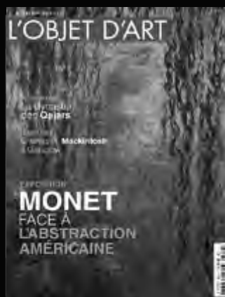
L'OBJET D'ART Les découvertes de l'histoire de l'art. L'actualité de l'art