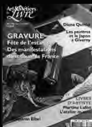
ART & MÉTIERS DU LIVRE Reliure, estampe, bibliophilie