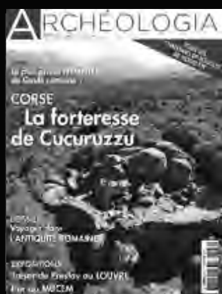
ARCHÉOLOGIA L'archéologie en France et dans le monde