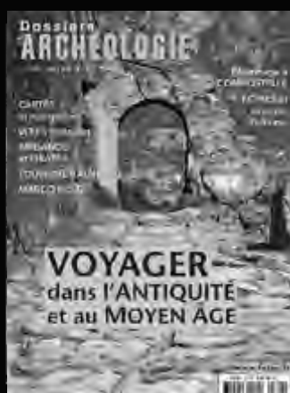
DOSSIERS D'ARCHÉOLOGIE Synthèse sur un thème majeur de l'archéologie