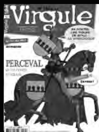
VIRGULE Le français et la littérature pour les 10-15 ans