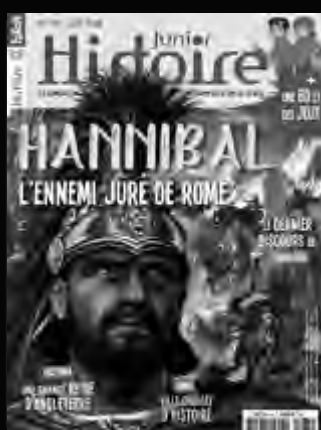
HISTOIRE JUNIOR Pour que l'histoire passionne les collégiens