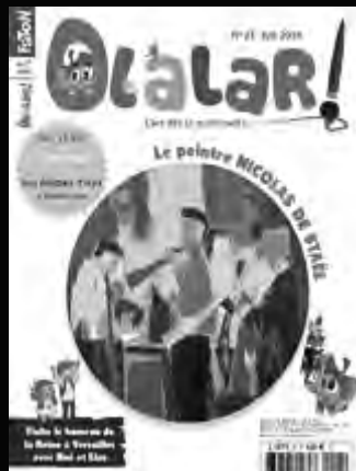
OLALAR L'art dès la maternelle pour les 4-7 ans