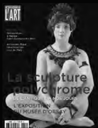
DOSSIER DE L'ART Monographie sur un grand artiste ou un mouvement artistique