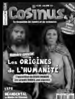
COSINUS Pour devenir curieux des maths et des sciences