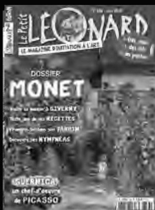
LE PETIT LÉONARD L'art expliqué aux enfants dans un magazine attrayant